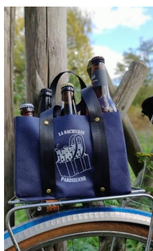
Balade en vélo

La Sacherie Parisienne est née d'un constat simple : le sac réutilisable est maintenant une norme pour le transport des biens alimentaires des particuliers, mais celui des liquides (bouteilles, cannettes) s'effectue presque toujours dans des contenants jetables (pack en carton, films plastiques).