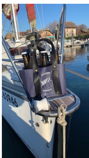
Balade en mer

La Sacherie Parisienne met les préoccupations du monde d'aujourd'hui au cœur de son activité en créant, concevant et fabriquant des sacs solides, réutilisables, à un prix abordable et fabriqués là où il seront vendus, en France.